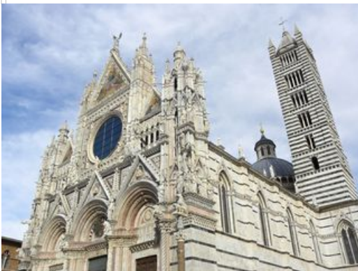
Dom von Siena