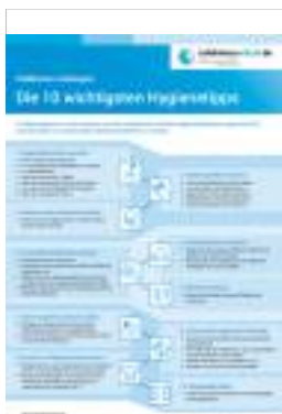
Die zehn wichtigsten Hygienetipps/Bundeszentrale für gesundheitliche Aufklärung

SO KÖNNEN SIE DAZU BEITRAGEN, DIE AUSBREITUNG DES CORONAVIRUS EINZUSCHRÄNKEN