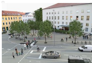
☹ Visualisierung der Neugestaltung mit Blick auf den Theatergarten