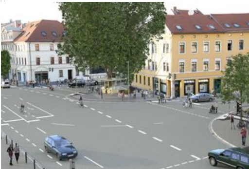
☞ Visualisierung der Neugestaltung mit Blick auf den Kiosk