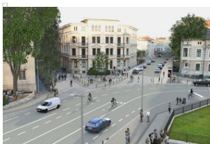
☹ Visualisierung der Neugestaltung mit Blick auf die VR Bank

Bei Änderungen und wichtigen Mitteilungen zum Bau und für die Anlieger erfolgt eine entsprechende Information bzw. eine Aktualisierung der Website. Eine Liste mit allen am Projekt beteiligten Ansprechpartnern finden Sie auf dieser Seite als pdf-Datei zum Herunterladen.