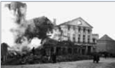
Zerstörtes Nationaltheater 1945