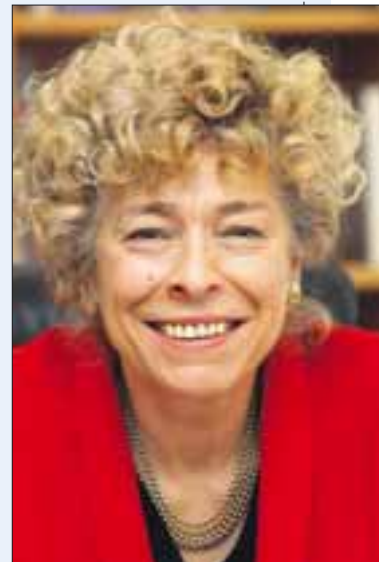
Prof. Dr. Gesine Schwan