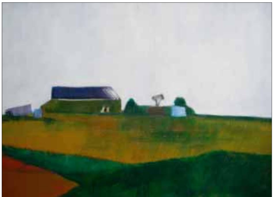
Sébastien Touret, »La vieille ferme«, 2007

Öffnungszeiten: Dienstag–Sonntag, 10–17 Uhr