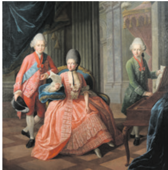
Anna Amalia und ihre Söhne, Gemälde nach der Restaurierung