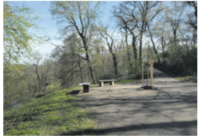
Constantinbaum, anlässlich des Jubiläums im Tiefurter Park gepflanzt.