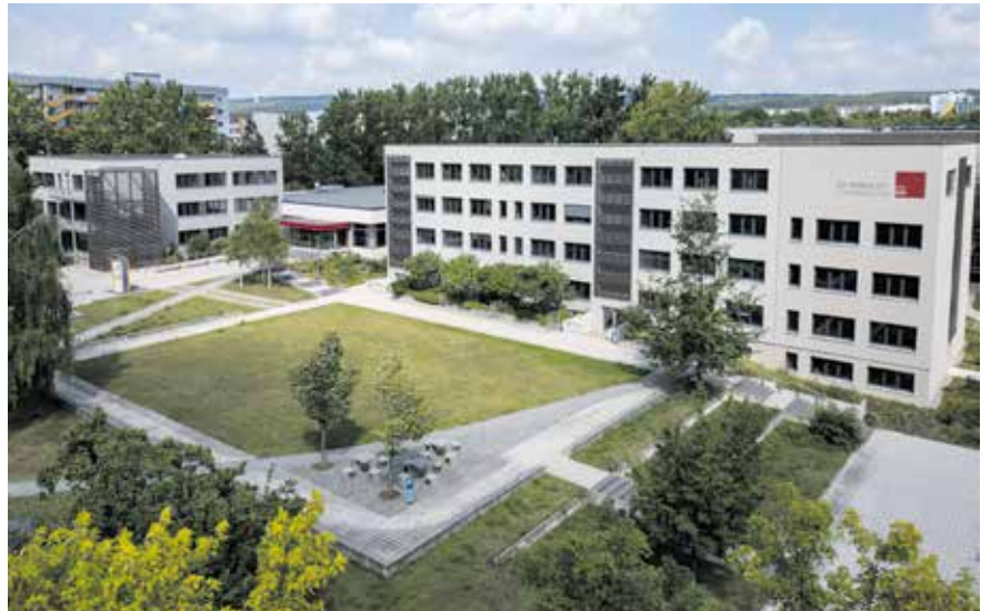
Das moderne Humboldt-Gymnasium in Weimar-West

schulamt.thueringen.de/mitte/schulamt/formulare https://stadt.weimar.de