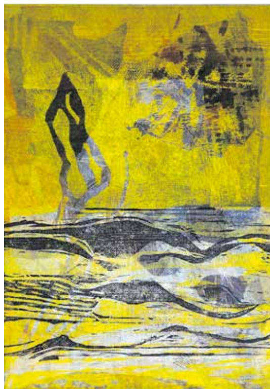
Martin Max: „fliessend“, 2023, Farbholzschnitt

Die 288 Seiten und 220 Abbildungen umfassende Publikation enthält auch die Ankündigungen der Sonderausstellungen des Stadtmuseums, sämtlicher Führungen und Vorträge. Wie gewohnt gibt es zudem Informationen rund um das Bertuchhaus und seines Fördervereins. Das vom Weimarer Büro „Waldmann. Büro für Gestaltung“ gestaltete Weimarer Geschichtsmagazin ist im „Abonnement“ über eine Mitgliedschaft im