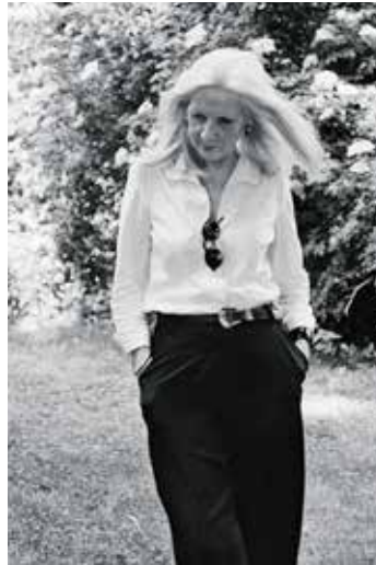
© Christian Rothe: Portrait von Manon Grashorn, 2013

In die Schaufenster-Galerie im Bilderhaus am Poseckschen Garten zieht im März mit der Malerin Manon Grashorn eine der profiliertesten Künstlerinnen Thüringens ein: Vom 5. März bis zum 9. Mai (Vernissage: 5. März, 18 Uhr) mit der Ausstellung „Vanitas in Weiß, Grau, Grün“. Grashorns Werk verdichtet expressive Pinsel- und Strichführung, Farbauftrag und Komposition zu poetischen, intensiven Bildräumen, in denen Schrift, Form und Struktur auf subtile Weise miteinander korrespondieren. Integrierte, verschlüsselte Textpassagen verweben sich mit Farbe, Linie und Fläche und eröffnen dem Betrachter einen eigenen Leseraum. Oft sind die Arbeiten von starker Abstraktion geprägt. Schichtungen und Überschreibungen verleihen ihren Bildern oft eine plastische Präsenz. Manon Grashorn wurde 1994 gemeinsam mit Burkhard Grashorn Preisträgerin des Wettbewerbs „Holocaust-Mahnmal Berlin“.