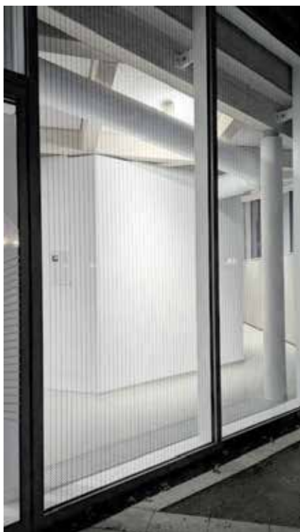
Beispiel für ein markiertes Fenster