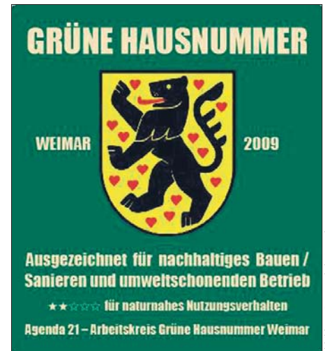
Abbildung: Büro »Lokale Agenda 21«

Die Konstruktion eines Gebäudes aus recycelbaren, nachwachsenden bzw. natürlichen Rohstoffen spielt ebenso eine große Rolle. Angefangen von der Fassadendämmung bis hin zu Wandkonstruktion und Holzschutz