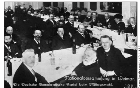
Die Fraktion der DDP beim gemeinsamen Mittagessen im »Fürstenhof«

Die Abgeordneten, auch wenn nie alle zugleich anwesend waren, fielen im Stadtbild Weimars auf. Anders als in Berlin liefen sie sich auch in ihrer Freizeit ständig über den Weg,