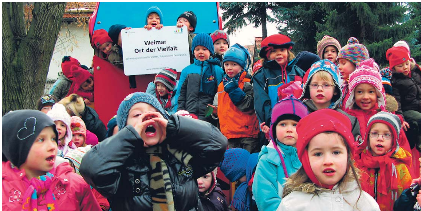
Die integrative Kindertagesstätte »Hufeland« in ihrem Garten – einer der zahlreichen »Orte der Vielfalt« in Weimar

Demokratie und den Bildungsprojekten für benachteiligte Bevölkerungsgruppen, den zahlreichen kleinen und großen Ausstellungen und Aktionen gegen Ausgrenzung und für das friedliche und kreative Zusammenleben aller in Weimar. Deshalb soll das Weimarer Ortsschild nun dorthin wandern, wo die Weimarer sich diese Auszeichnung verdient haben: zu den vielen verschiedenen großen und kleinen Weimarer »Orten der Vielfalt«. Jeden Monat neu wird dieses Weimarer Ortsschild deshalb von nun an überraschend an einem