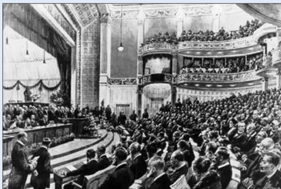
Eröffnung der Nationalversammlung im DNT am 6. Februar 1919. Zeichnung von Hans W. Schmidt

Weitere Informationen: Internet: www.ausstellung-weimarer-republik.de