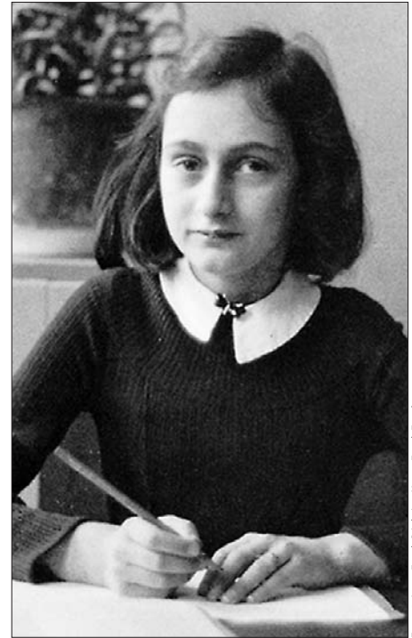
»Anne Frank – Eine Geschichte für heute«

■ »Figurenspiel«. Die Ausstellung wird in Weimar um lebensgroße Figuren am Eingang erweitert. Schulklassen, die die Ausstellung besuchen, haben die Möglichkeit, sich anhand dieser Figuren mit ihrem Umfeld, ihren eigenen Befindlichkeiten und mit ihrem Alltag zu konfrontieren.