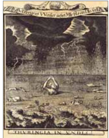
Bild aus: Lage, Georg Wilhelm von der: Die vollständigen ACTA Der Thüringischen Sünd-Fluth des Jahres 1613, 1720 (Stadtarchiv Sign. 88–224)

Vor 398 Jahren , am 29. Mai 1613, ging über dem Herzogtum Sachsen-Weimar ein Unwetter nieder, welches als »Thüringer Sintflut« in die Geschichte eingehen sollte. Wie aus dem Nichts bildeten sich gegen 16 Uhr dicke Regenwolken. Hagel und Platzregen prasselten derart auf Weimar und Umgebung nieder, dass Bäche und Flüsse rasch über die Ufer traten. Acht Meter über Normal stand die Ilm an der Steinbrücke in Oberweimar. In den Häusern, vorwiegend aus Lehm gebaut, barsten die Fenster und der Hagel zerschlug die Dachschildeln. 44 Wohnhäuser und etliche Scheunen wurden einfach weggespült; in Weimar sind in diesen Stunden 65 Menschen ertrunken, 14 von ihnen starben in der Niedermühle. Das Wasser hatte eine solche Höhe erreicht, dass es über das Kegeltor hinweg sprudelte und durch die Schießlöcher des Frauentors floss. Doch die Stadtmauer hielt glücklicherweise stand. Auch in Oberweimar und Ehringsdorf starben 27 Menschen in den Wassermassen. Erst gegen drei Uhr und nach fünfständigem Hagel beruhigte sich das Wetter. Das ganze Ausmaß der Schäden wurde sichtbar: die Saat verloren, die Obstwiesen voller Schutt und Lehm, Lustgärten und Nebengelasse des Schlosses einfach nicht mehr da.