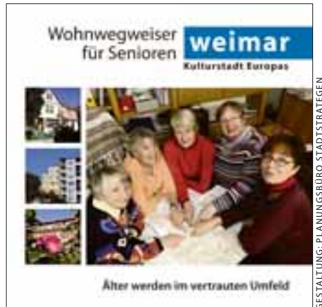
GESTALTUNG: PLANUNGSBURO STADTSTRATEGIEN

http://stadt.weimar.de/staedtisches-leben/senioren/wohnen-im-alter/