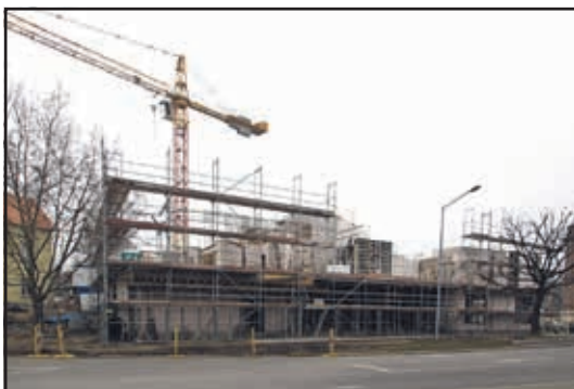
Rathenauplatz - Südseite