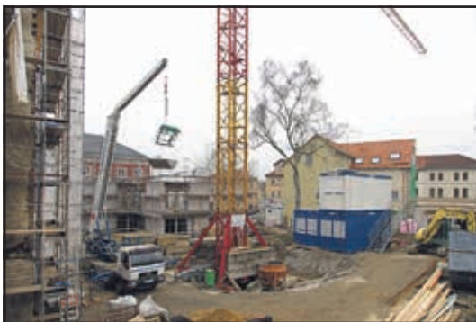
Rathenauplatz - Nord-Ost-Seite