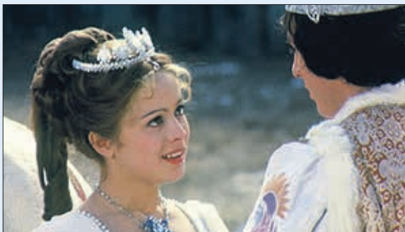
Der Klassiker »Drei Haselnüsse für Aschenbrödel« zog zahlreiche Fans zum 2. Weimarer Märchen-Filmfest.