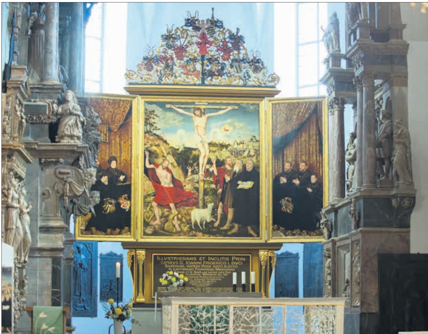
Der Cranachaltar in der Stadtkirche St. Peter und Paul gehört zu den wichtigsten bildlichen Darstellungen der Thüringer Reformationsgeschichte. Am 3. April wird im Schiller-Museum die Ausstellung »Cranach in Weimar« eröffnet.

Mehr Infos zum Themenjahr Cranach 2015: http://wege-zu-cranach.de , www.cranach2015.de