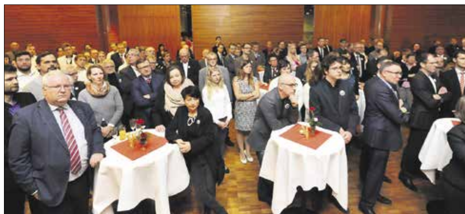
Mehr als 200 Gäste hörten eine kämpferische und ambitionierte Rede des Oberbürgermeisters zu den Herausforderungen des neuen Jahres.