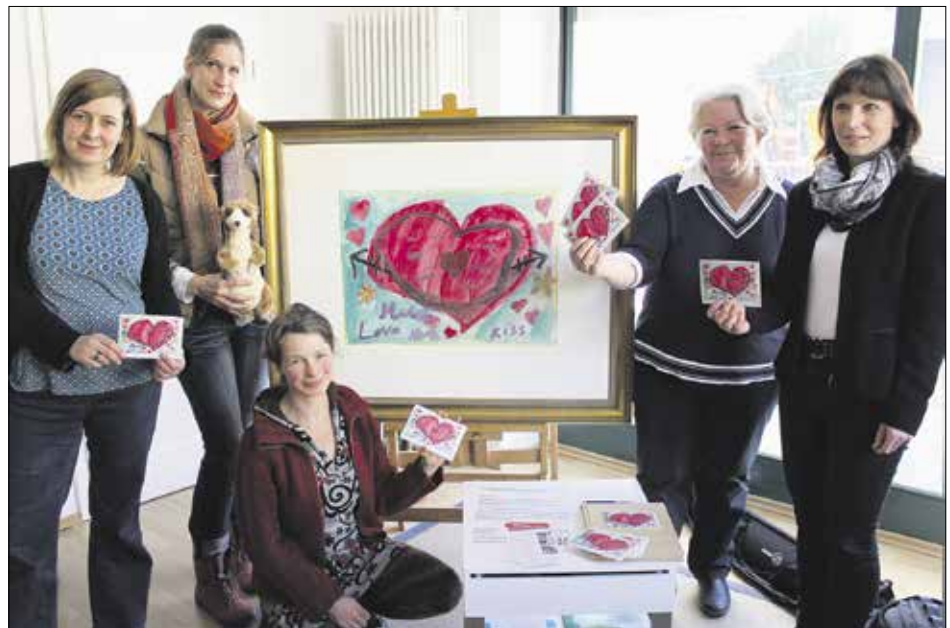
Das »Herz-Bild« eines Weimarer Flüchtlingskindes fand seinen ersten Ausstellungsplatz bei der Bürgerstiftung.

Das Herz als Motiv ist bei den Flüchtlingskindern – Jungs und Mädchen – äußerst beliebt. Im Gegensatz zu deutschen Kindern, die bei freier Motivwahl selten ein Herz malen würden. Bezüge zur aktuellen Flüchtlingssituation und der einhergehenden Feindseligkeit sowie zum Slogan »Herz statt Hetze« sind