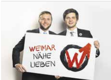
SPD-Fraktionschef Thoralf Canis und SPD- Kreisvorsitzender Sven Steinbrück