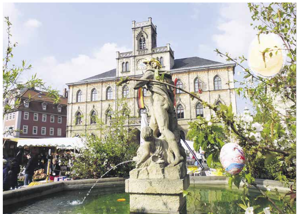
Der Weimarer Ostermarkt findet in diesem Jahr bereits zum siebten Mal statt und öffnet am 8. und 9. April 2017 auf dem Marktplatz seine Pforten.

Jeweils von 9 bis 18 Uhr werden von rund 60 Anbietern neben ostertypischen Waren auch kunsthandwerkliche Produkte, Geschenkideen, Floristikartikel, Spielwaren sowie Waren des alltäglichen Bedarfs (Lebensmittel und Gebrauchsgegenstände etc.) angeboten. Für das leibliche Wohl ist durch verschiedene Imbiss- und Getränkeangebote ausreichend gesorgt.