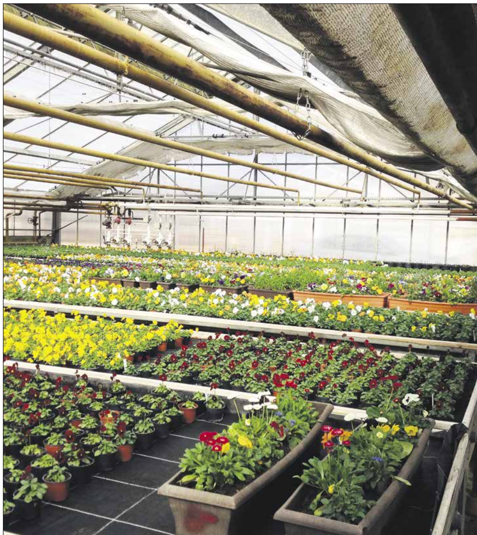
Mehr als 40.000 Pflanzen wurden für den Frühjahrsflor 2017 in der Stadtgärtnerei in Tröbsdorf angezogen. Neben den beliebten Stiefmütterchen oder Vergissmeinnicht auch Pflanzen mit klangvollen Namen wie »Viola cornuta« oder »Beacon Yellow«.

Der Gestaltung der wichtigsten Beete an exponierten Standorten wie z.B. am Theaterplatz, am August-Baudert-Platz, im Weimarahallenpark und am Poseckschen Garten liegen detaillierte Pflanzpläne zugrunde, welche die Gestaltungsidee veranschauli-