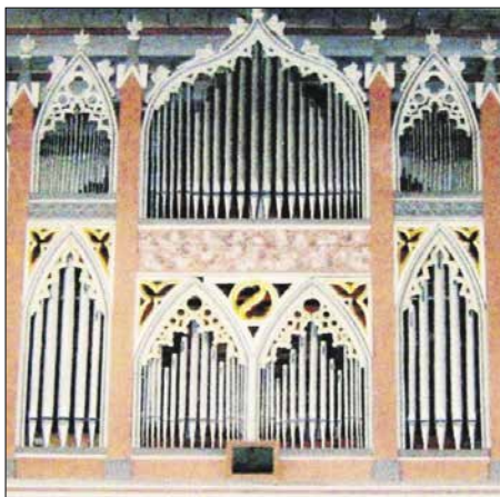
Die Kirchgemeinde Taubach hat 2015 beschlossen, die Witzmann-Orgel denkmalgerecht zu sanieren.