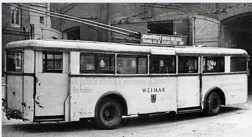
O-Bus vor der alten Halle, dem ursprünglich für die Straßenbahnen neben dem E-Werk gebauten Depot. Losungen am Bus und über dem Hallentor (»Weltfestspiele«) erlauben die Datierung dieser seltenen Aufnahme in das Jahr 1951.

Vor 60 Jahren: Umzug der O-Busse in ein neues Domizil