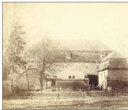
Die »Lottenmühle«, um 1880

Freunde des Stadtmuseums bieten öffentliche Führungen an