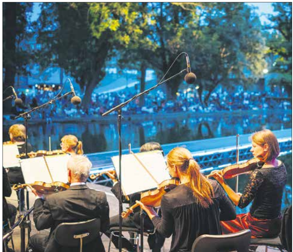
Konzertnacht im Weimarahallenpark

Karten gibt es an der Theaterkasse des Deutschen Nationaltheaters Weimar, Telefon: (0 36 43) 755 334, in der Tourist Information Weimar (0 36 43) 745-0 oder online unter www.nationaltheater-weimar.de oder www.weimarahalle.de .