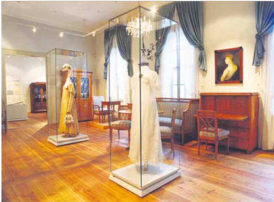
Blick in die Ausstellung zur Stadtgeschichte

Interessenten sind herzlich in das Stadtmuseum Weimar, Karl-Liebnecht-Str. 7, eingeladen. Eintritt inklusive Führungsgebühr: 4,50 Euro, ermäßigt 2,50 Euro, zur Kinderveranstaltung ist der Eintritt frei.