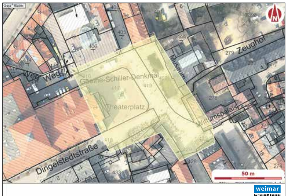
Lageplan der Verbotszone Theaterplatz