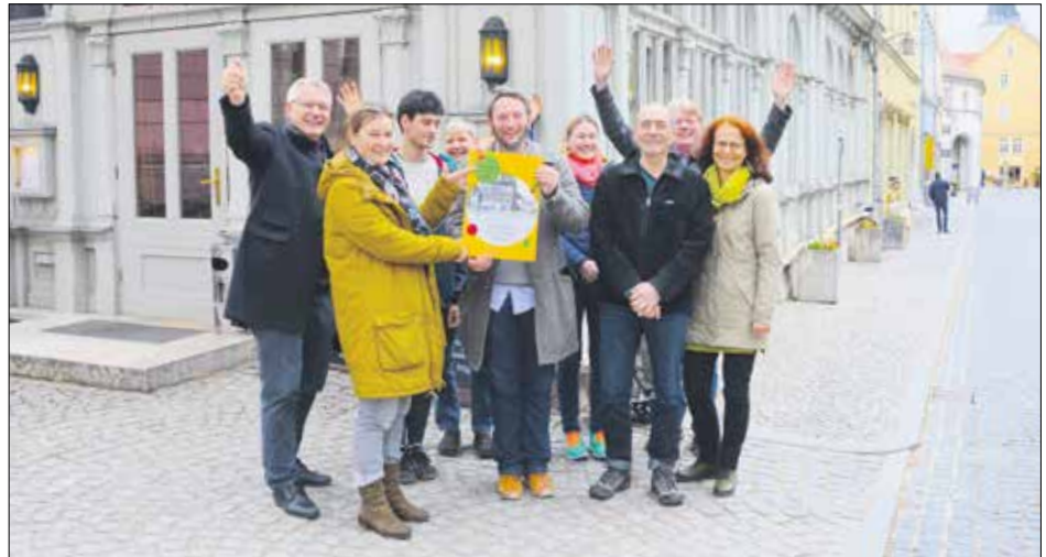
Am historischen Gründungsort feierte das Team der Volkshochschule/mon ami im März das 100-jährige Bestehen der Volkshochschule Weimar.

Das Team der Volkshochschule Weimar und des mon ami wünscht allen Gästen, Freundinnen und Freunden ein frohes Weihnachtsfest und ein gutes Neues Jahr!