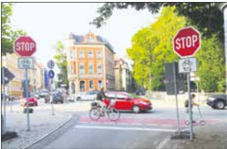
Weimar ist beim Wettbewerb des Bundesforschungsministeriums dabei

Das Bundesministerium für Bildung und Forschung (BMBF) unterstützt im Rahmen des Wettbewerbs »MobilitätsWerkStadt 2025« rund 50 kommunale Projekte. Gemeinsam mit relevanten Akteuren aus Wirtschaft, Zivilgesellschaft und Forschung sollen die Kommunen lokal angepasste Lösungen für die Mobilität der Zukunft erarbeiten. Nun steht fest, in welchen Städten Mobilitätsmanagerinnen und -manager im Jahr 2020 hierfür ihre Arbeit aufnehmen.