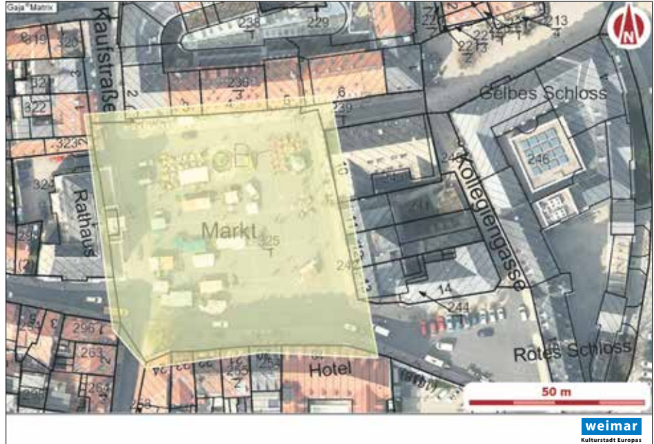
Lageplan der Verbotszone Markt