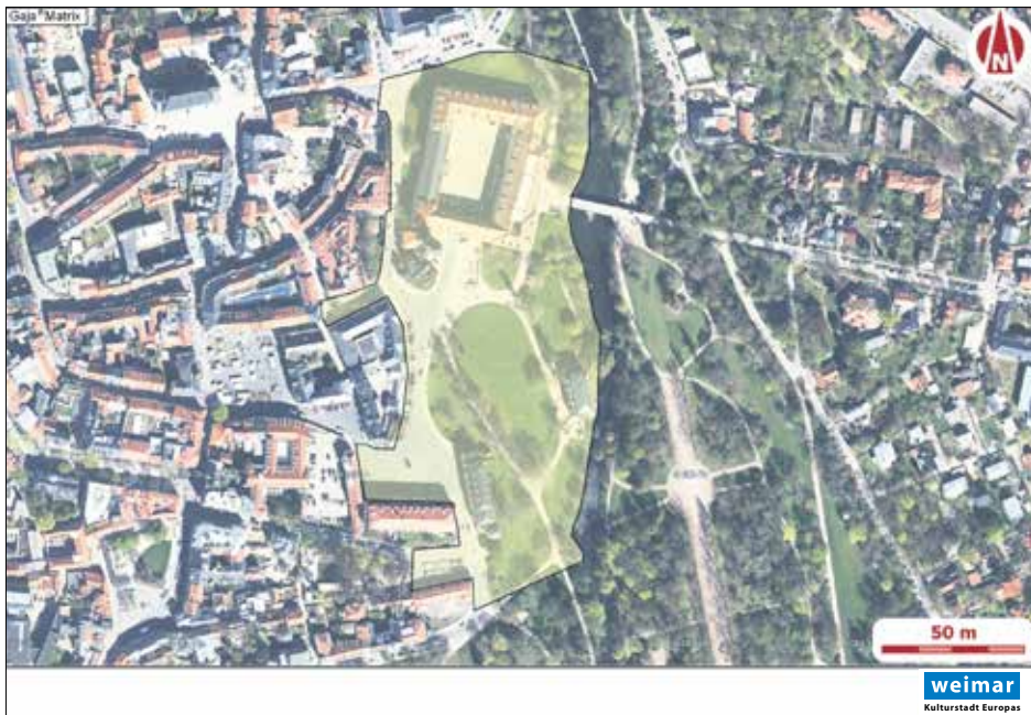
Lageplan der Verbotszone Stadtschloss