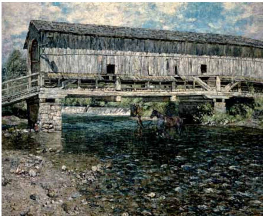
Christian Rohlf, Die gedeckte Ilmbrücke in Buchfahrt bei Weimar, 1889

gen des Belgiers zählt, in Gänze zu bewundern. Die Sanierung durch die Architekten Pitz & Hoh (Berlin) sowie Junk & Reich (Weimar) zielte auf Reparatur und Rückbau der winkelförmigen Anlage von 1905/06 und damit auf Wiedergewinnung eines originalen Van-de-Velde-Baus, der bereits seit 1996 auf der Liste des UNESCO-Welterbes steht. Die Räume des Werkstattgebäudes, darunter auch das Atelier van de Veldes, werden künftig von der Fakultät Gestaltung der Bau-